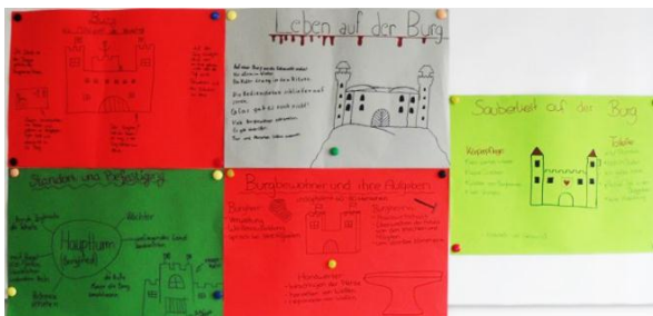
Abb. 2: Die Schülerinnen und Schüler präsentieren ihre Ergebnisse (hier anhand eines Gallery Walks).