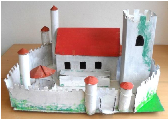
Abb. 1: Schülermodell einer Ritterburg als möglicher Einstieg