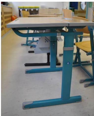
Abbildung 3: höhenverstellbarer Tisch

Die Höhe und die Form des Arbeitstisches richten sich nach den individuellen Gegebenheiten und Möglichkeiten des Kindes. Ein Haltegriff kann als Unterstützung zur Aufrichtung sinnvoll sein.