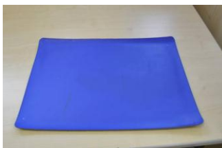
Abbildung 1: farbige Schreibtischunterlage

Ein strukturierter und klar gegliederter Arbeitsplatz kann zur Aufmerksamkeitsbündelung und Konzentration beitragen. Bebilderte Ordnungssysteme erleichtern die Orientierung und fördern die Selbstständigkeit der Schülerinnen und Schüler. Eine Begrenzung des Arbeitsplatzes, sowie Schalen für Werkzeuge und Material können im Sinne der Strukturierung Klarheit verschaffen. Farbige Tischunterlagen unterstützen die visuell-räumliche Organisation. Rutschfeste Unterlagen haben sich als hilfreich erwiesen.