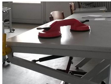
Abbildung 4: Haltegriff

Ein fester, stabiler Stuhl bietet eine notwendige Voraussetzung, um sich auf die manuelle Tätigkeit konzentrieren zu können. Die Füße sollten flach auf dem Boden stehen und der Bauch den Tisch berühren. Ein Keilkissen kann zur Rumpfaufrichtung und zur Fußbelastung beitragen.