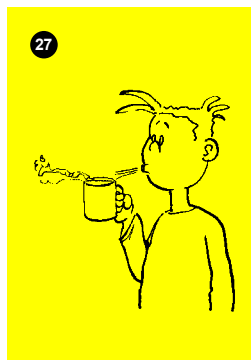
Abb.: Jacobsen, P., Stegmeier, S. & Zieske, S. (2018). Karte Nr. 27

Die Schülerinnen und Schüler halten eine Tasse heißen Kakao vor ihren Mund. Sie versuchen das Heißgetränk durch vorsichtiges Blasen abzukühlen. Der Luftstrom muss gezielt und leicht über die „Tasse“ strömen. Es darf nichts überschwappen.