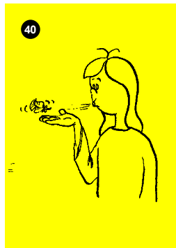
Abb.: Jacobsen, P., Stegmeier, S.& Zieske, S. (2018). Karte Nr. 40

Eine Feder wird aus der Hand gepustet und wieder aufgefangen. Dabei wird der Atem mit einem kräftigen Stoß aus dem Körper gepustet. Es entsteht ein Einatmungsreflex, weil sich das Zwerchfell durch die stark federnde Ausatmungsbewegung sofort wieder senkt.