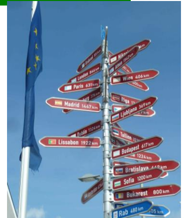
Wegweiser am Europaplatz

Erkläre durch die Bearbeitung der folgenden Aufgaben Gästen aus nah und fern einige Besonderheiten der Stadt Königsbrunn und des Umlandes.