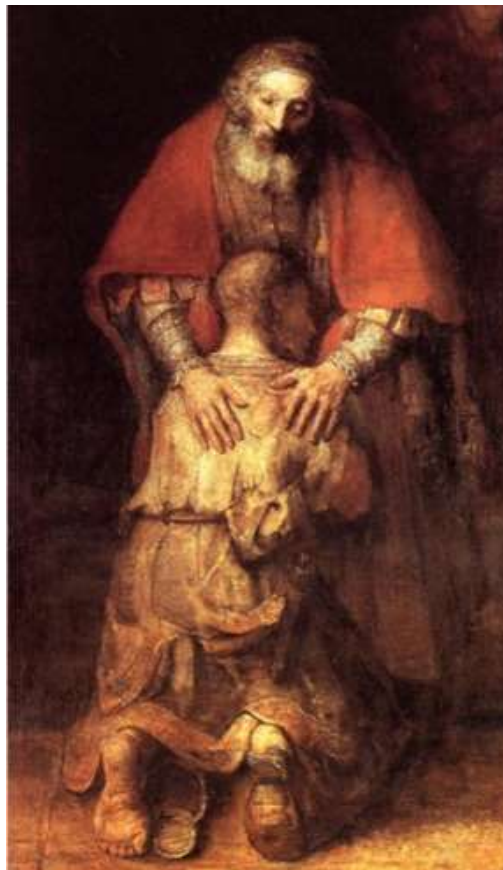
Rembrandt Harmensz van Rijn: Rückkehr des verlorenen Sohnes, um 1669

Du kennst dieses Bild und du kennst auch die Geschichte zu diesem Bild. Was geschieht hier?