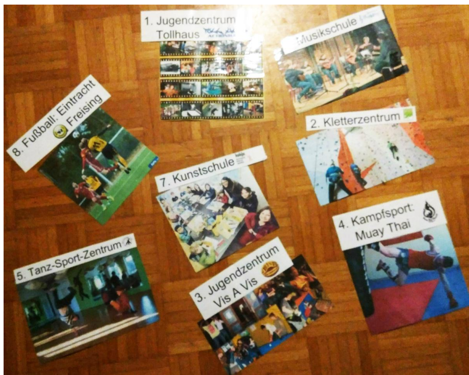
Abb. 1: Schülerinnen und Schüler entdecken und ordnen Freizeitangebote