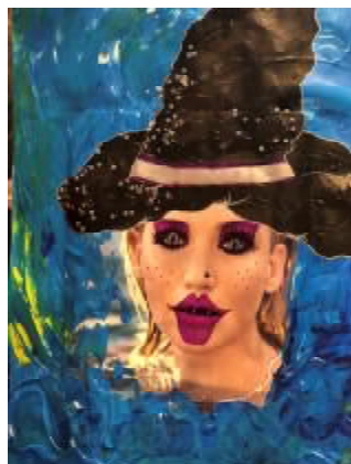
Abb. 3: Überschminken des Models