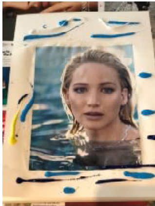
Abb. 1: Vorbereiten des neuen Covers