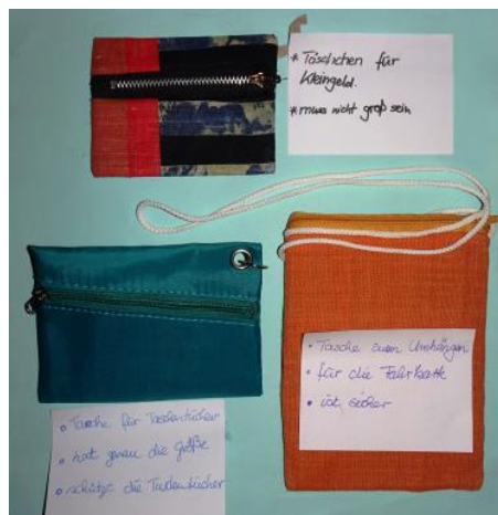
Abbildung 1 Verwendungsmöglichkeiten der Täschchen:

Begründungen der Schülerinnen und Schüler für die Auswahl: