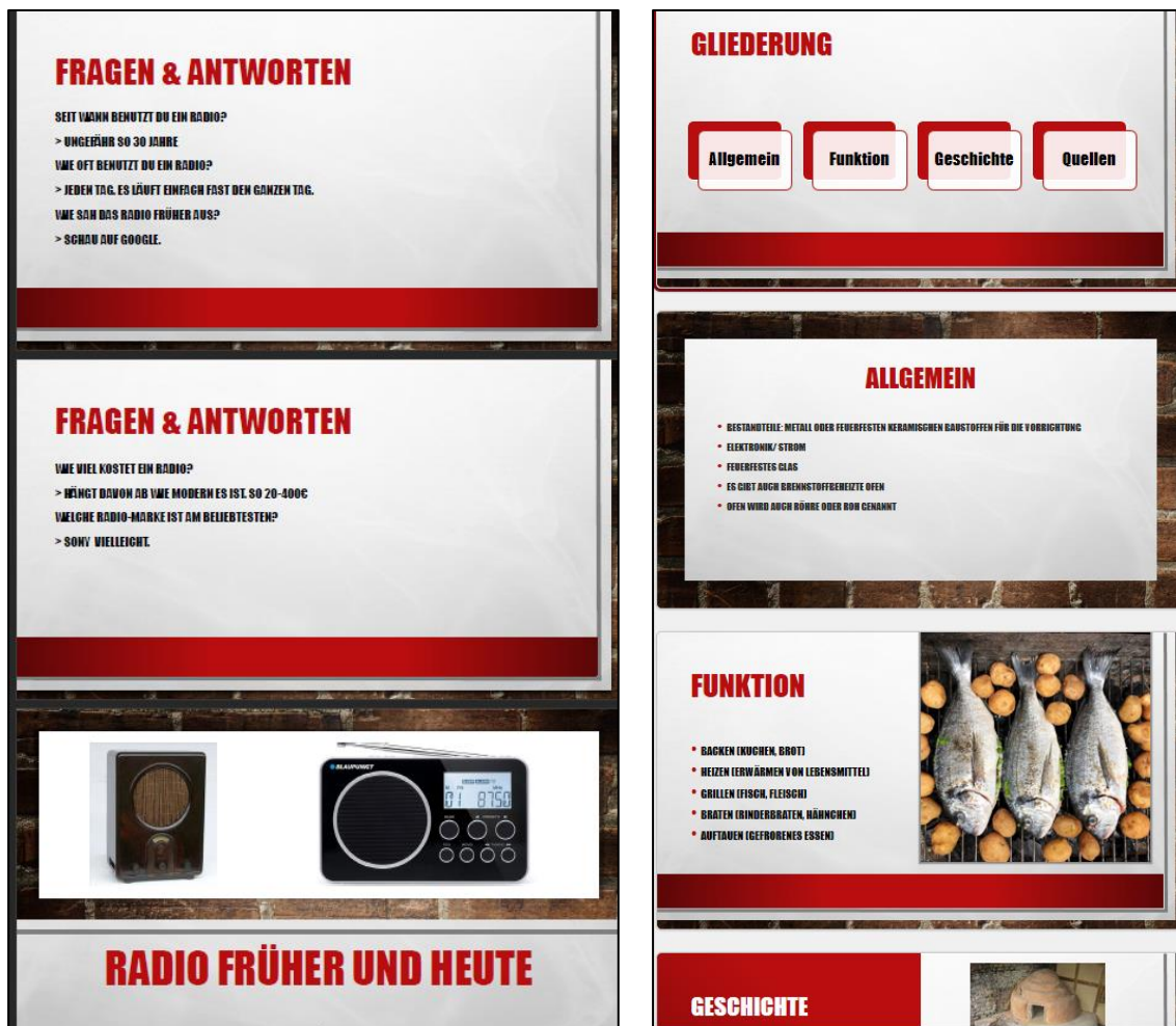
Abb. 2: Beispiel für den Einsatz digitaler Medien für das Präsentationsergebnis 2