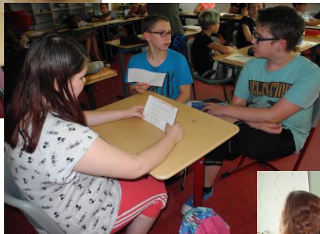
Dreierteams beim Üben