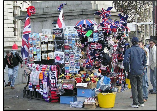
Souvenir shop in London (s. Seite 5)