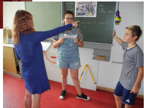
Dreierteam bei der Präsentation vor der Klasse