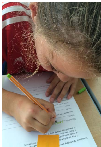
Einprägen und Aufschreiben