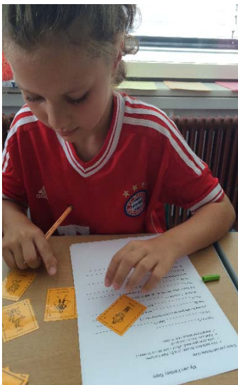
Auswahl des Wortes

Beim Eintragen der Einzelwörter in den vorgegebenen Lückentext achten die Schülerinnen und Schüler auf fehlerfreies Abschreiben von den Vorlagen.