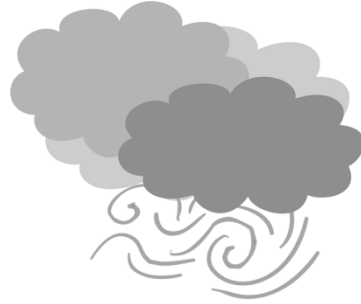
Bildkarte für windy / strong winds