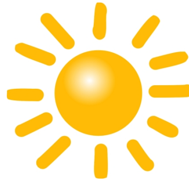
Bildkarte für sunny