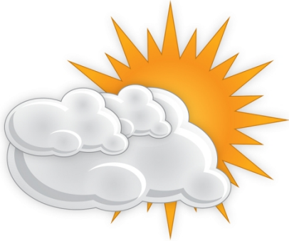
Bildkarte für partly sunny