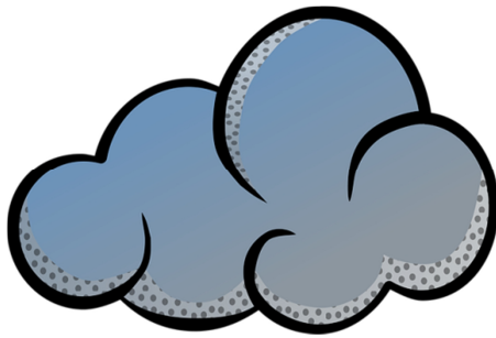
Bildkarte für cloudy