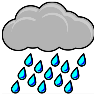
Bildkarte für rainy