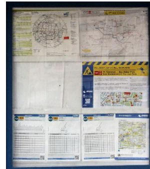
Abb.3 und 4: Aushänge an Bushaltestellen mit Informationen zu den Fahrplänen der Buslinien.

Impuls: Zeigt uns eure Bushaltestelle und nennt den Bus, mit dem ihr am Nachmittag Fahrziele erreichen könnt.