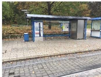
Abb.1: Foto des Wartehäuschens einer Bushaltestelle, das die typischen Merkmale zeigt.