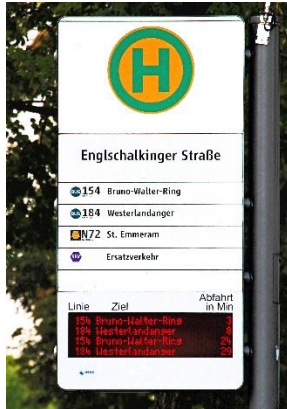
Abb.2: Haltestellenschild mit digitaler Anzeige