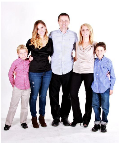
CC0 Public Domain