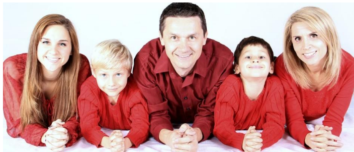
CC0 Public Domain

An: giuliano753@mail.it Kopie: Blindkopie: Betreff: Von: melanie916@schreibmir.de