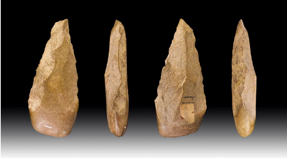
Faustkeil, entstanden vor ca. 500 000–300 000 Jahren, aus unterschiedlichen Blickwinkeln fotografiert