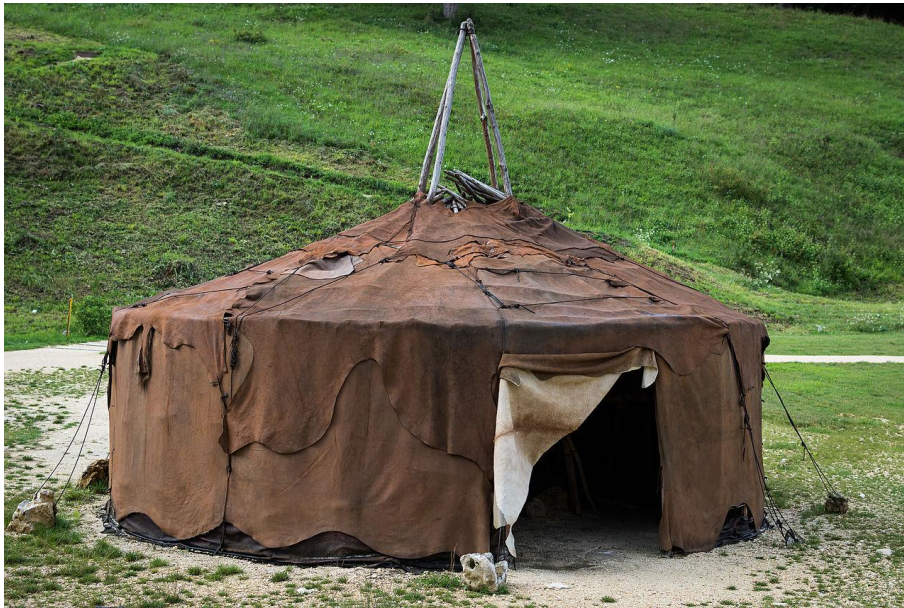
Rekonstruktion (Nachbau) eines altsteinzeitlichen Zeltes (Archäopark Vogelherd, Niederstotzingen)