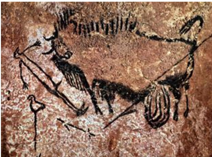
Jagd auf ein Bison mit Waffen