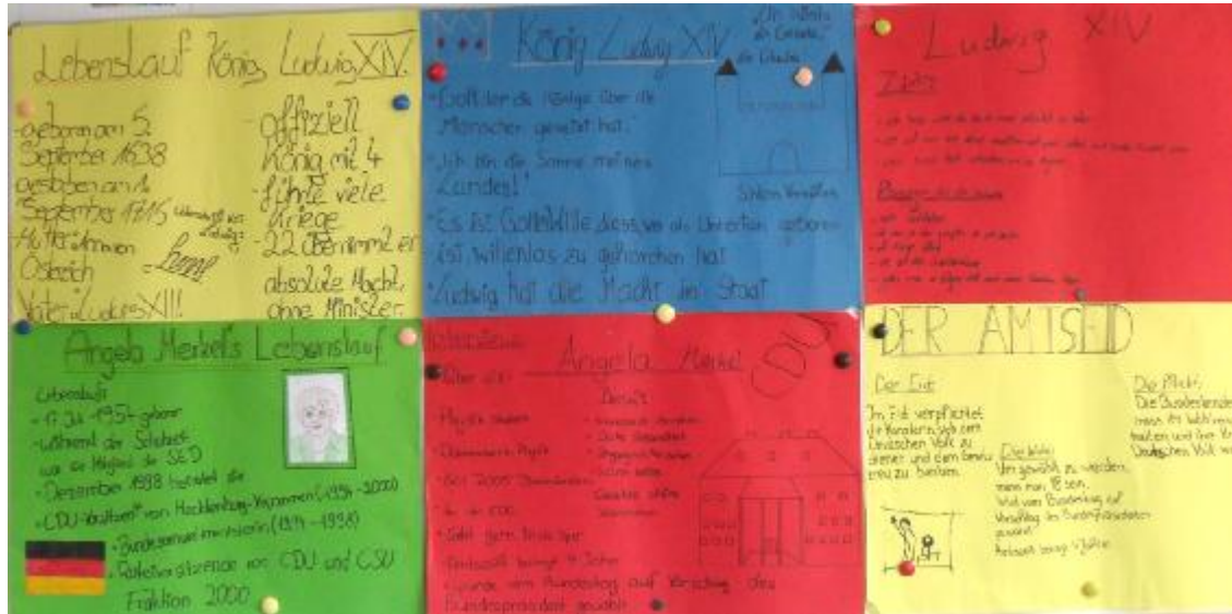
Abb. 1: Die Schülerinnen und Schüler präsentieren ihre Ergebnisse (hier anhand eines Gallery Walks).