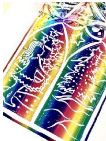
Abb. 1 - 8: Entstehung des Märchen im Glasfenster