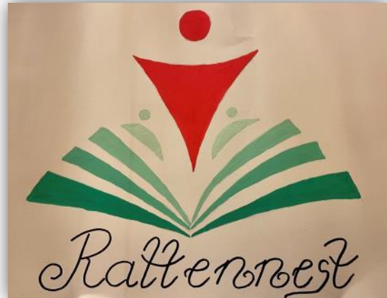
Abb. 1 und 2: Schullogo, digital überarbeitet im Vergleich zum Logo für die Schülerbücherei