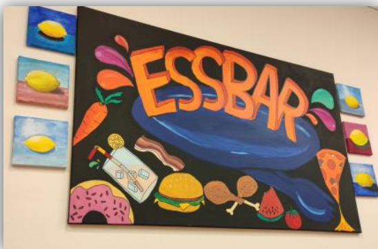
Logo für die Schulmensa „Essbar“