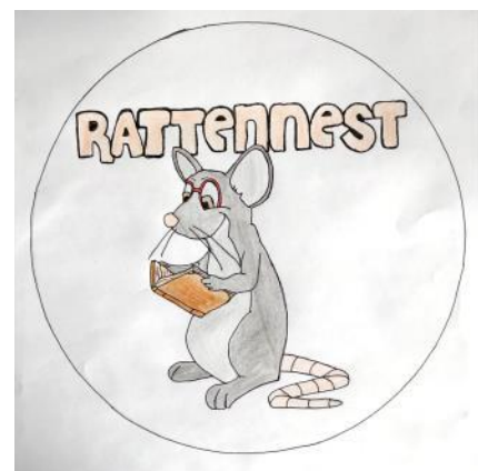
Abb. 3 – 5: weitere Beispiele für das Logo der Schülerbücherei