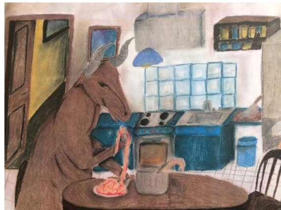
Spaghetti sind so lecker Erkennbarkeit der Umgebung in der Perspektive sehr deutlich