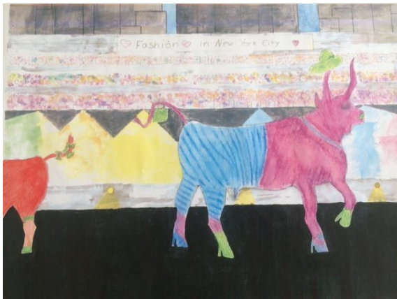
Auf dem Laufsteg Surrealistische Bildidee der Verfremdung gut umgesetzt