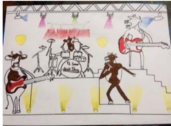
Einmal Rockstar sein Surrealistische Bildidee sehr deutlich