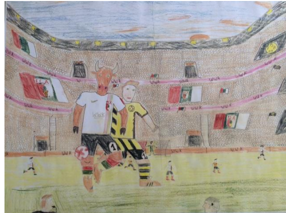
Einmal Fußballstar Gegensatz reale/ surreale Welt umgesetzt Farblich geschickt hervorgehoben