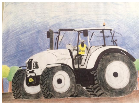
Einmal selbst der Chef surrealistische Bildidee der Verfremdung deutlich