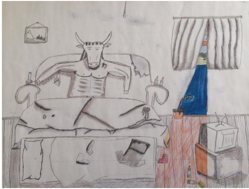
Chillen auf dem Sofa Erkennbarkeit der Umgebung detailliert