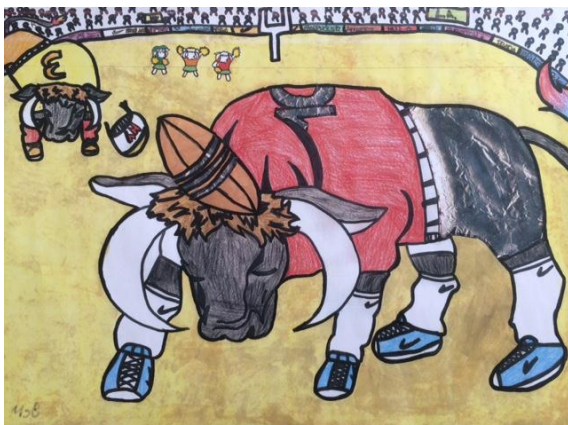
In der Stierkampfarena Größenverhältnisse gut umgesetzt