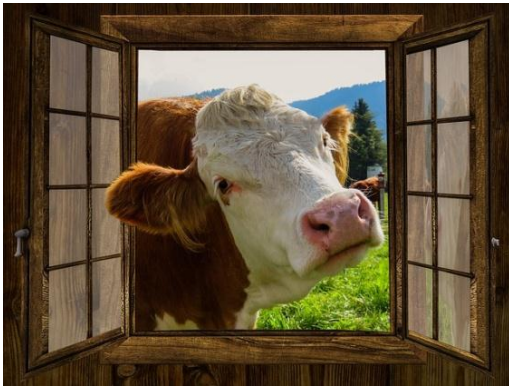
Eine Kuh träumt von einer anderen Welt.