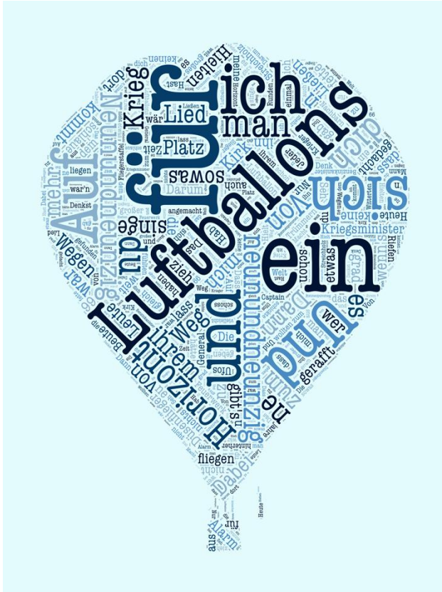
Abbildung 2: "99 Luftballons" (digital/wordsalad)