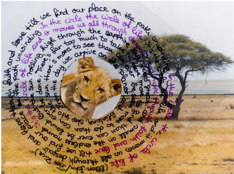
Abbildung 5: "Circle of Life" (Mischtechnik: Foto, Stift, Papier, Folie)