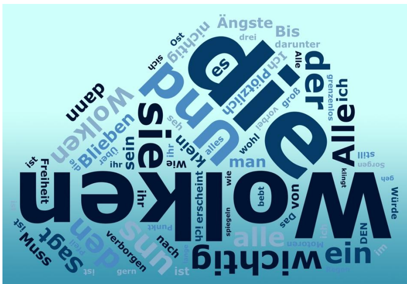
Abbildung 1: Gestaltung „Über den Wolken“ (digital/ phoetic)