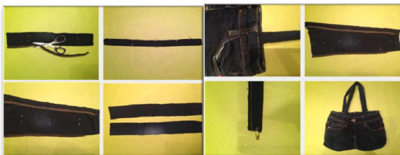
Abbildung 3 Phase 3: Taschenträger nähen und annähen