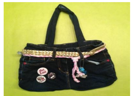
Abbildung 4 Phase 4: Jeanstasche ausgestalten

Ergänzend zu Abbildung 4 werden die Originaltasche und weitere mögliche Accessoires (z. B. Knöpfe, Biegelbilder, Bordüren) zur Ausgestaltung angeboten.