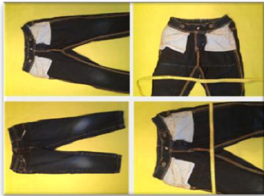
Abbildung 1 Phase 1: Jeans vorbereiten