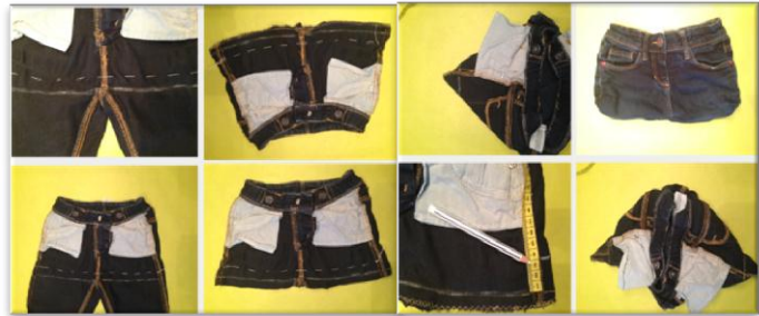
Abbildung 2 Phase 2: Jeanstasche nähen